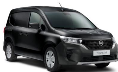
Čierna Enigma GNE – 600 €