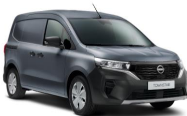
Sivá Urban KPW – 300 €