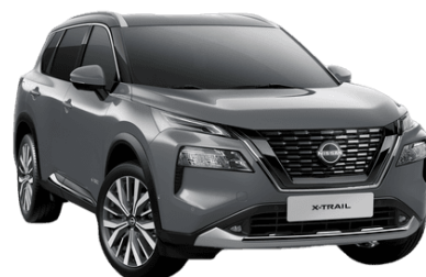
Sivá Ceramic KBY - 850 €