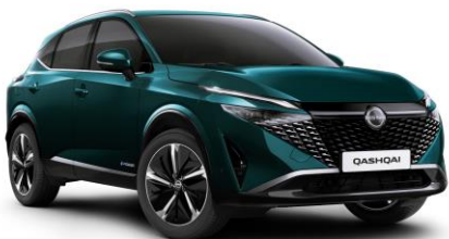
Zelenomodrá Ocean FAP - 800 €