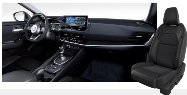
Látkové čalúnenie čierne [G]