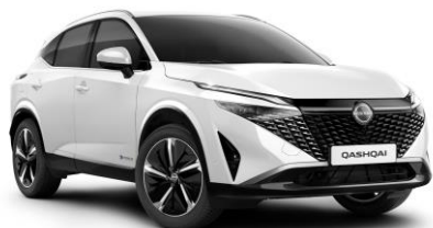
Biela Pearl QBE - 800 €