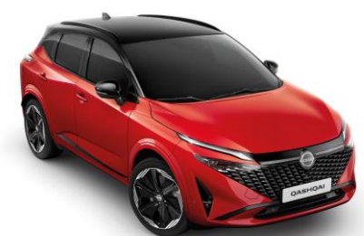
Červená Sunset a Čierna YAU - 1000 €