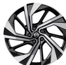
20" Disky kolies z ľahkých zliatin