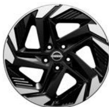
18" Disky kolies z ľahkých zliatin