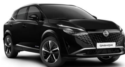
Čierna Pearl GAT - 600 €