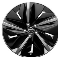
19" Disky kolies z ľahkých zliatin