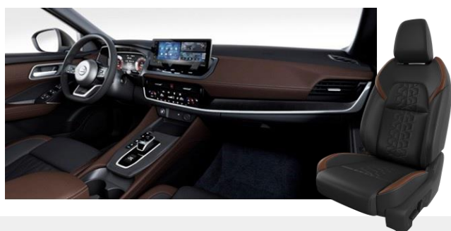
Syntetická koža čierna / hnedá [H]