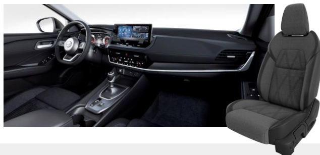
Látkové čalúnenie čierne / sivé [G]