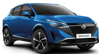
Modrá Magnetic RCF - 800 €