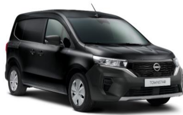
Čierna Enigma GNE – 600 €