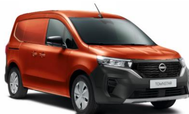
Oranžová Terracotta CNZ - 600 €