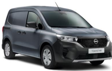
Sivá Urban KPW – 300 €