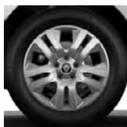
17" disky kolies z ľahkých zliatin