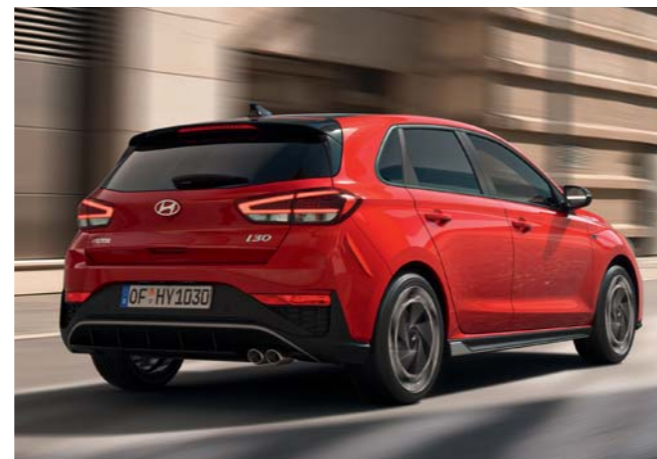
Dynamický zadný nárazník a čierny zadný spojler (Hatchback) Exkluzívne kolesá