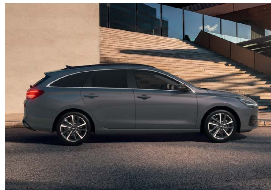
i30 Fastback i30 Kombi