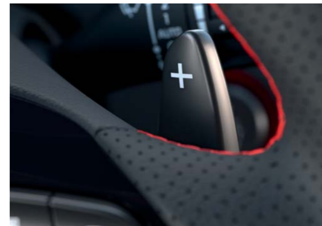
N Line radiace pádla Červené akcentné prešívanie (DCT prevodovka)

Kokpit nového modelu i30 N Line vás pozýva na dynamickú jazdu exkluzívnymi prvkami ako športový volant s poťahom z perforovanej kože a kovové pedále.