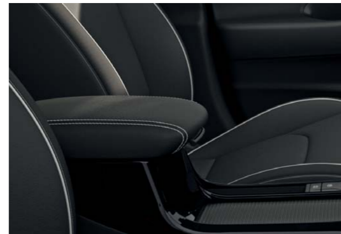
Dotykový displej 26 cm (10,25") Posuvná lakťová opierka