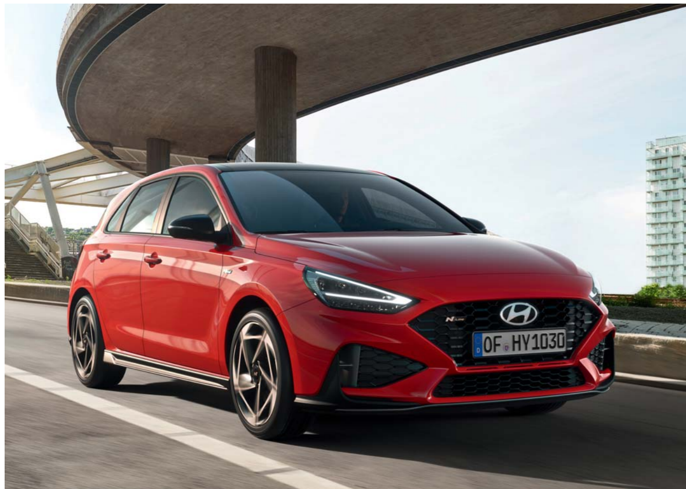
Výrazná predná časť vďaka LED denným svetlám v profile V