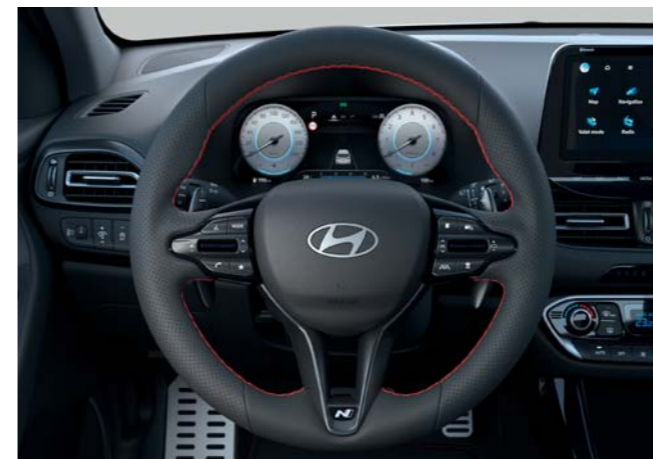
N Line volant potiahnutý perforovanou kožou N Line športové sedadlá