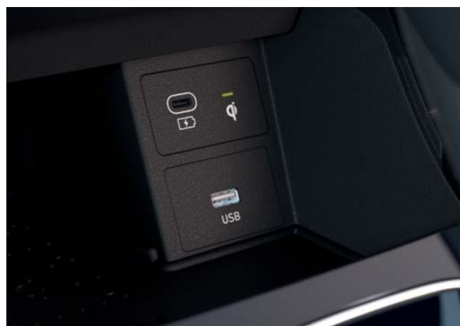
Centrálny dotykový displej 26 cm (10,25") USB-C nabíjací port vpredu