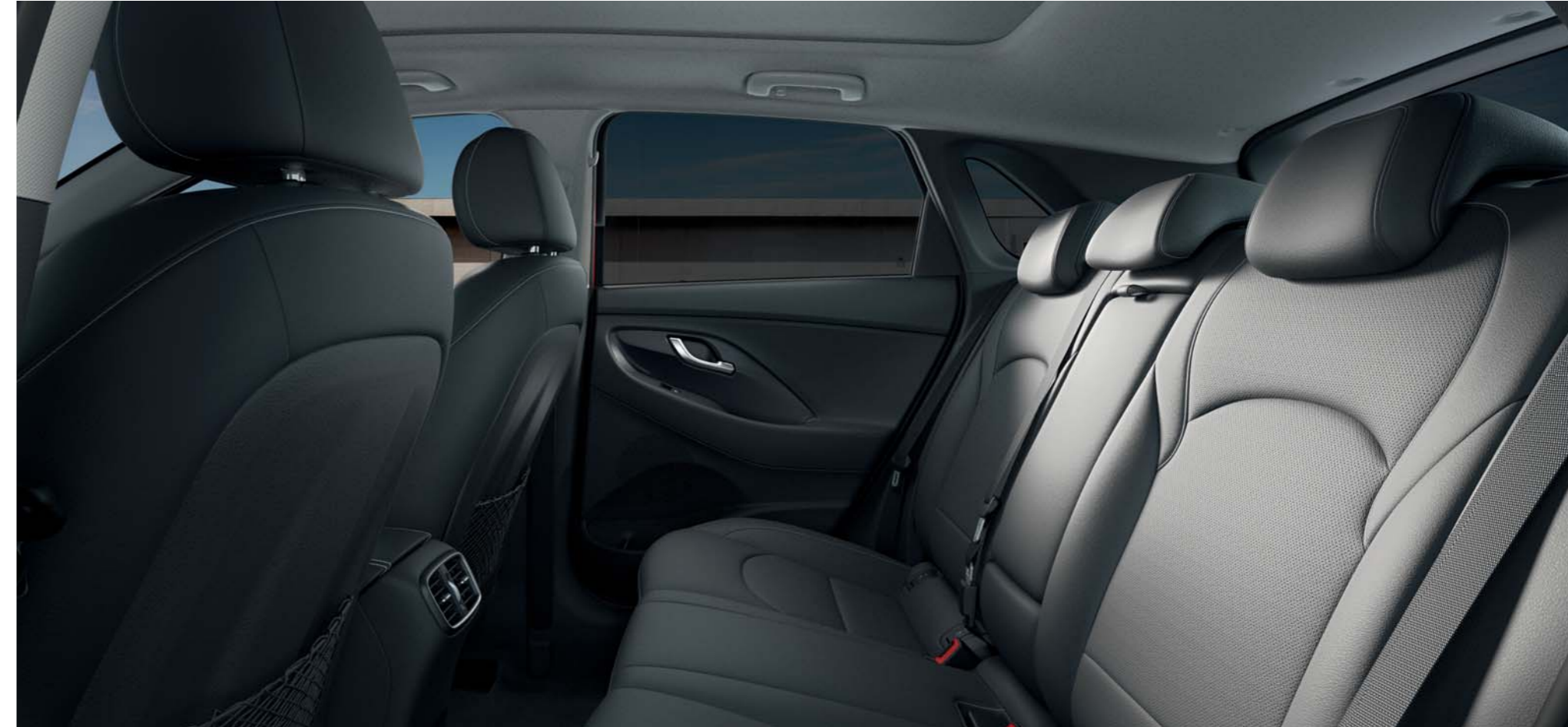
Sedadlá sú na výber s poťahom z látky, kože alebo kombinácie oboch materiálov